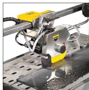
Mobiler mehrfachgelagerter Schneidekopf mit Wippe und integriertem Gasdruckdämpfer, sichert einen präzisen Schnitt.