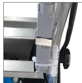
Wasserpumpe mit Steckverbindung zur raschen und sicheren Wartung.