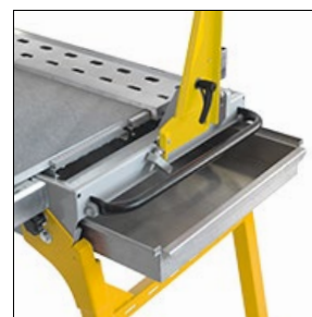
Ausziehbare Wasserwanne zur einfachen und schnellen Reinigung.